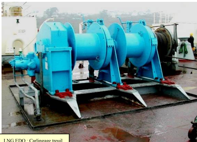
LNG.EDO : Carlingage treuil