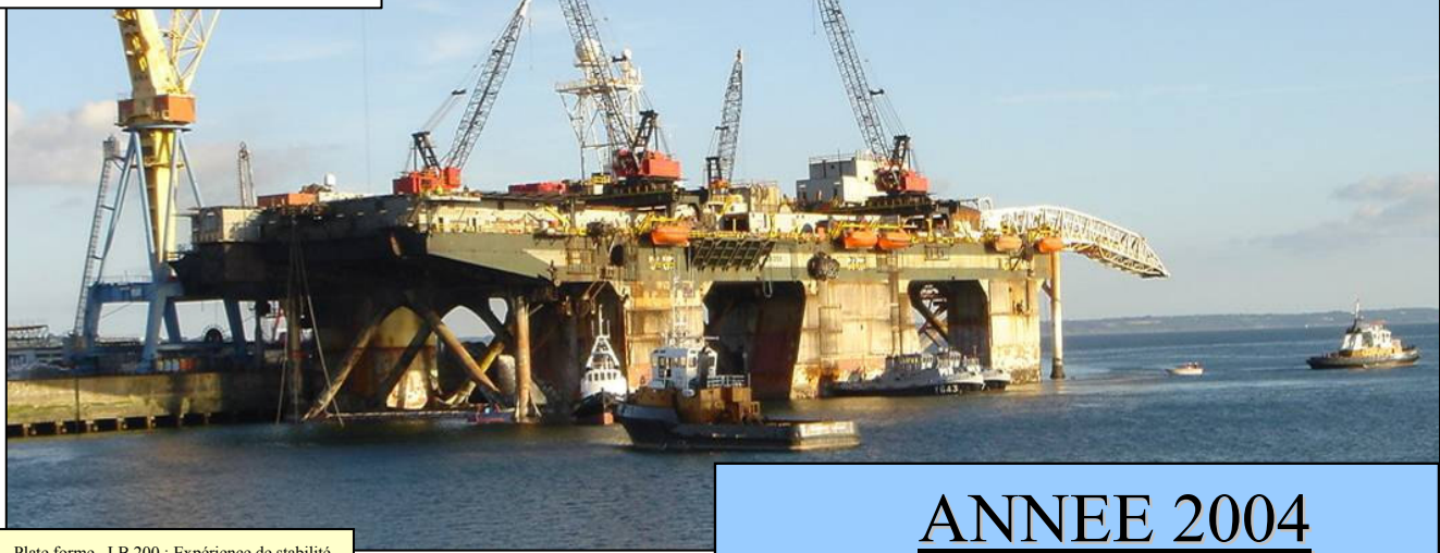
Plate forme LB 200 : Expérience de stabilité