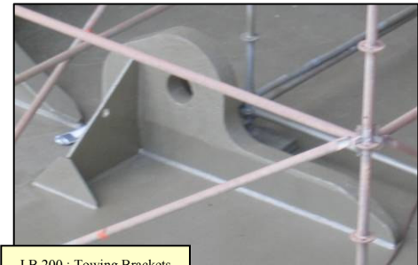
LB 200 : Towing Brackets