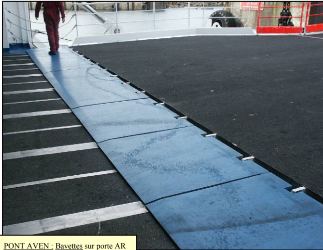
PONT AVEN : Bavettes sur porte AR